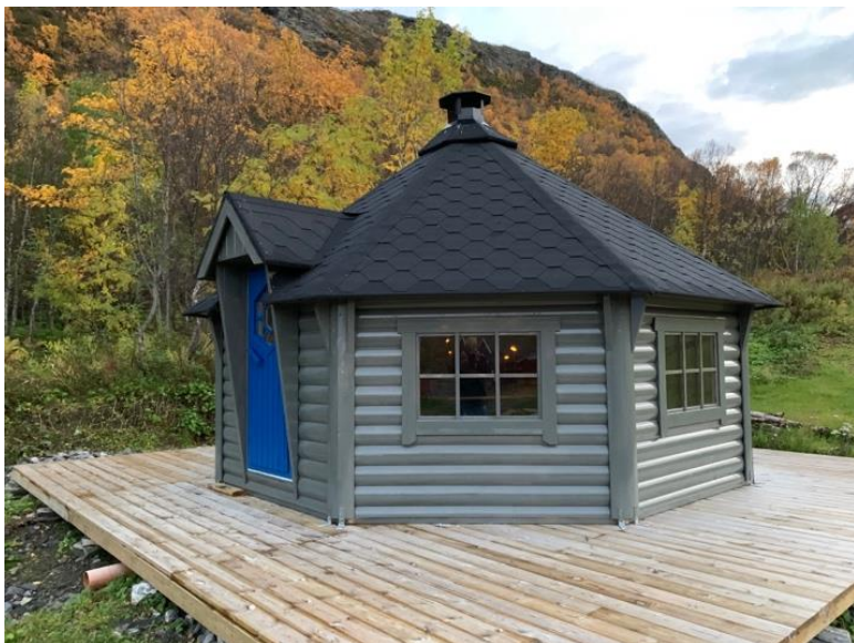
Denne står i Sandvågen, Skjervøy